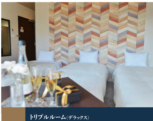
トリプルルーム(デラックス)