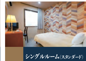
シングルルーム(スタンダード)