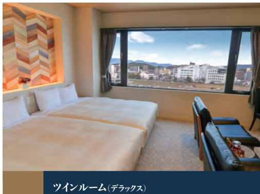
ツインルーム(デラックス)