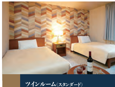
ツインルーム(スタンダード)