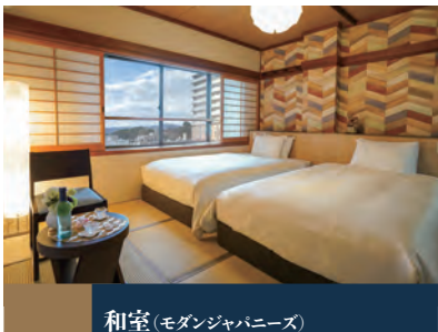
和室(モダンジャパニーズ)