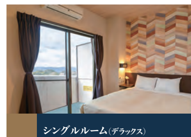
シングルルーム(デラックス)