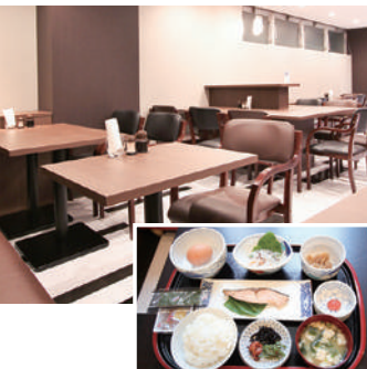
朝食レストランコーナー

マイクロバブルジェットとは、直径1000分の3mmサイズの超微細泡を発生させる装置です。薬品や香料を使用しておらず、水と空気だけでできているので安心してご入浴いただけます。また、一般のジェットバスと異なり、エアレス仕様のため、静かでゆったりとしたバスタイムをお楽しみいただけます。広めの浴槽で、ごゆっくりとおくつろぎくださいませ。