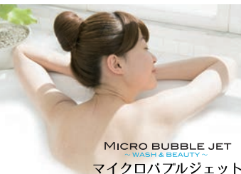
MICRO BUBBLE JET WASH & BEAUTY マイクロバブルジェット