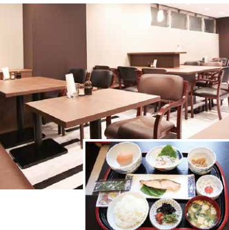
朝食レストランコーナー

マイクロバブルジェットとは、直径1000分の3mmサイズの超微細泡を発生させる装置です。薬品や香料を使用しておらず、水と空気だけでできているので安心してご入浴いただけます。また、一般のジェットバスと異なり、エアレス仕様のため、静かでゆったりとしたバスタイムをお楽しみいただけます。広めの浴槽で、ごゆっくりとおくつろぎくださいませ。