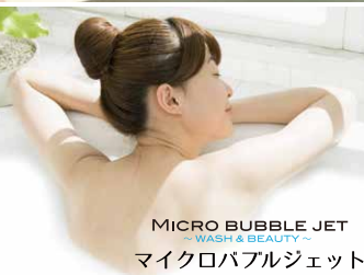
MICRO BUBBLE JET マイクロバブルジェット

当ホテルの浴室には、 マイクロバブルジェットを 標準装備しております。 (一部の客室を除きます)